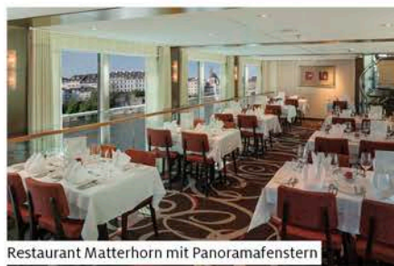
Restaurant Matterhorn mit Panoramafenstern